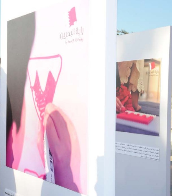
جانب من صور المعرض