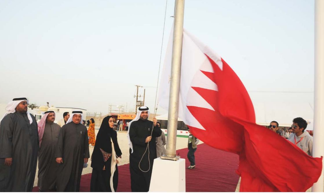
جانب من فعاليات المحافظات الخمس